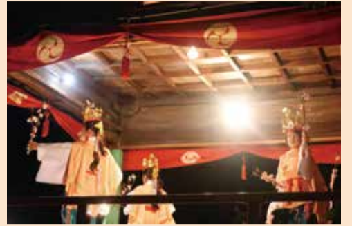
華やかな衣装や小道具を使った花舞(稚児舞)