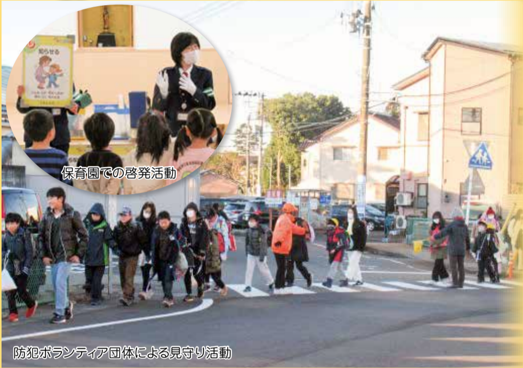
保育園での啓発活動