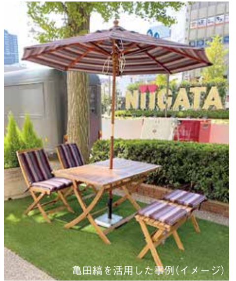
亀田縞を活用した事例(イメージ)

■亀田縞利用促進協議会 (江南区産業振興課内、 ☎025-382-4809、 ✉sangyo.k@city.niigata.lg.jp)