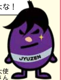
江南区親善大使 十全さん

6月下旬~9月下旬は江南区名産の「十全なす」が旬だZE! ほのかな甘みがある巾着型のナスで、煮る・炒める・漬けるなど、様々な料理に使えるオールマイティな万能ナスだZE! ぜひ食べてくれよな!