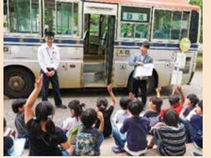
運転手にたくさん質問