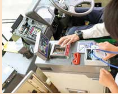
「リゅうと」や現金での支払い方法を体験

バスは環境にも優しい移動手段です。ちょっとした外出などの際には、ぜひ、ご家族でバスをご利用ください。