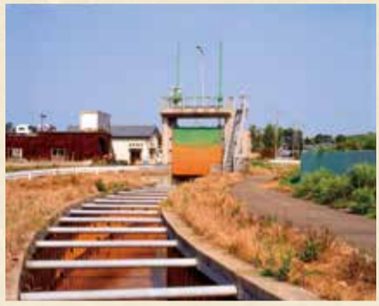
横越排水路上流調整ゲート