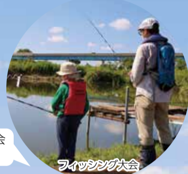
フィッシング大会