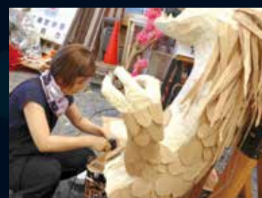
大岩万燈制作の様子