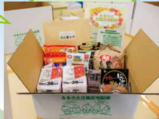
送付イメージ(昨年度の内容)