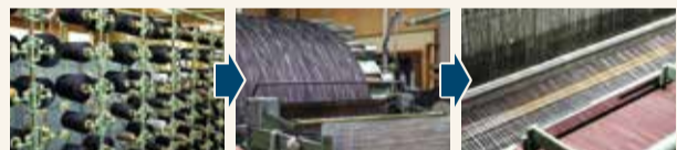
たていと経糸を機械にセット

1本の中に太い部分と細い部分がある糸を約3,000本使い、様々な色を混ぜることで、素朴であたたかい風合いの縞模様をつくります。