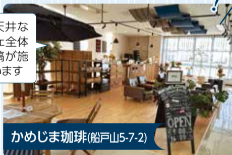
かめじま珈琲(船戸山5-7-2)