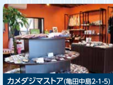
カメラジマストア(亀田中島2-1-5)