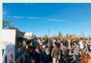
よこごし公園マルシェ

11月10日に、子育て世代に人気のよこごし公園で初のマルシェを開催しました。今年度新たに整備したキッチンカースペースに13店舗が出店し、美味しい農産物やフードが提供されました。当日は天候にも恵まれ、約3,000人ももの来場があり、大いに賑わいました。10月28日には、プロレスラーの方などから寄贈されたソメイヨシノ5本の記念植樹が行われました。坂井区長は、「この桜が満開の花を咲かせ、来園者を出迎えることで、この公園の魅力がさらに増し、より多くの方に親しんでいただけることを期待しています」と話しました。今後も、公園を活用した様々なイベントを開催します。ぜひ、足をお運びください。