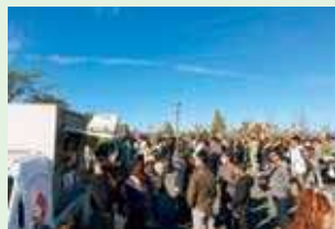
よこごし公園マルシェ