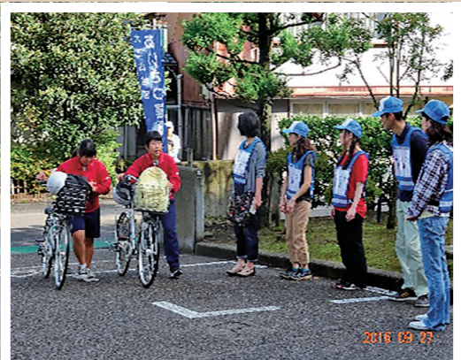
大江山中学校校門前の写真

この運動は住民相互のつながりや絆づくりをはぐくむため、小中学校の児童生徒も含め明るく元気な挨拶を行うことにより、青少年の健全育成及び地域コミュニティの活性化を図る目的として行われたものです。