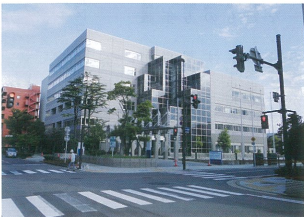
会場の新潟市生涯学習センター（中央区礎町通）

九月より後期ゼミナールが始まりますが、日程が合わず断念いたしました。配布された資料を再読しながら地域コミュニティづくりや、まちづくりの役割を果たして行きたいと思っております。