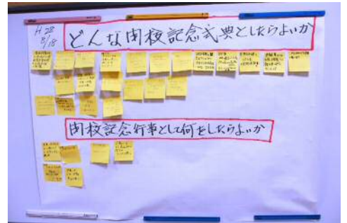
アイデアを付箋にかいて掲出