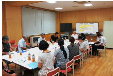
総務記念式典部会の様子