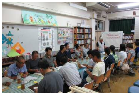
記念事業部会の様子