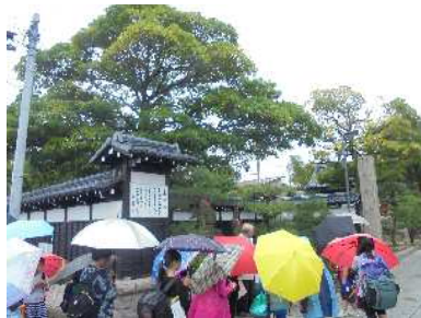
お寺巡りは雨天決行！ちょっと大変だったな