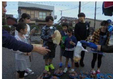
朝市では、旬の食材、何を買おうかな。