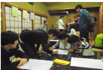
夜のお楽しみは、班対抗寺リンピック！！