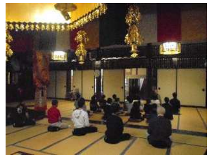
座禅体験では、姿勢を正して精神統一。