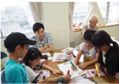
始まりの集いでは班旗を楽しく作ったよ