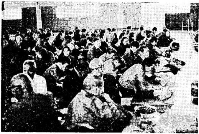
うれしい集い (今年の敬老会)

町行政と一体化の立場 から特に町長も列席され 老人クラブ関係代表、民 生関係、社会教育関係者 等二十余名が出席、基本 案についての懇談が重ね られた。その結果、次の ような構想が承認された