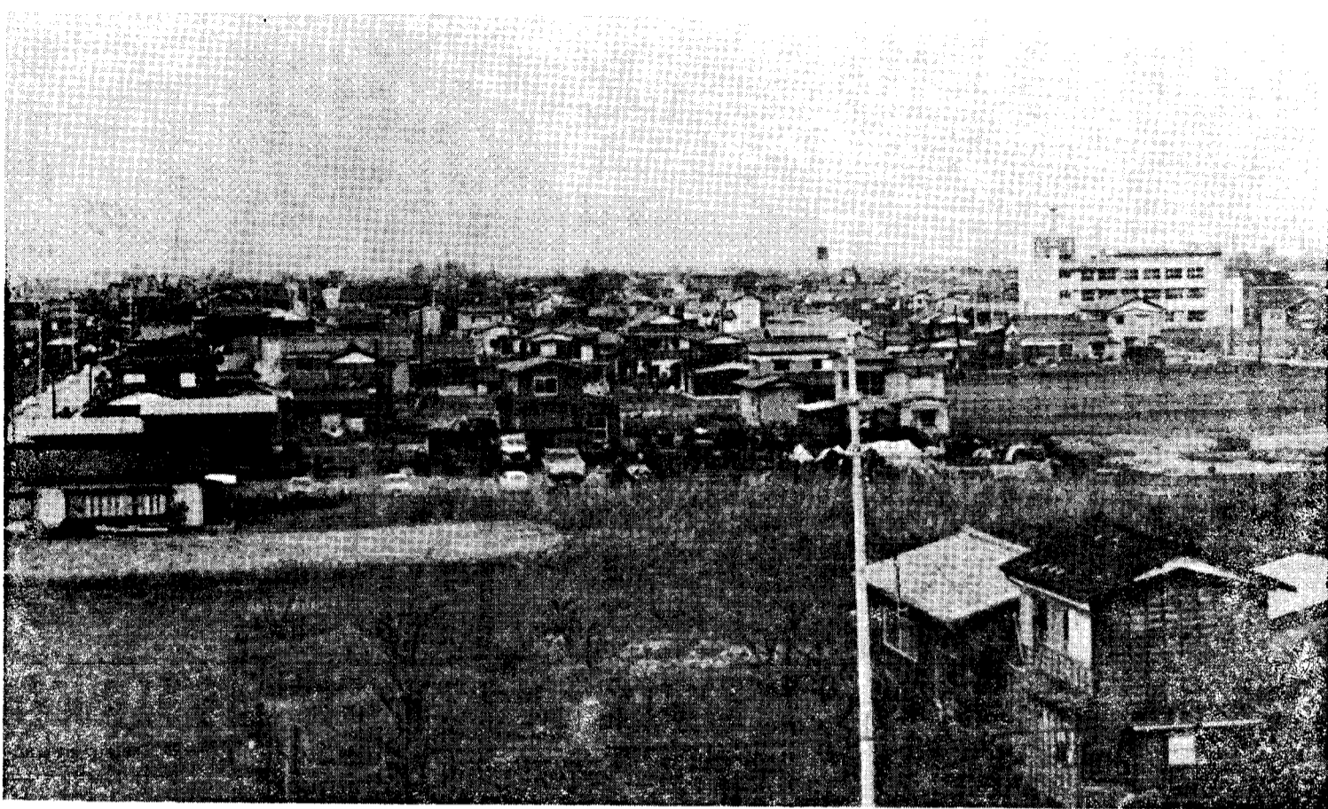
伸びゆく郷土 中学校屋上より町部遠望