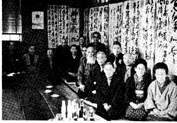
(長寿大学書道クラブ) クラブ活動で喜びと生きがい

これは、これまで、老人クラブをはじめ、長寿大学の皆さんの活発な学習活動の成果と、これに対して町の多大のご支援があったからで、これから高令者の皆さんの益々のご精進と活躍を期待いたします。 以下その内容について