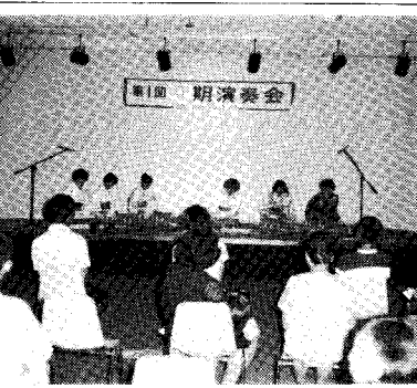
ギターと琴の調べ 小須戸ギタークラブ 8月7日中央公民館3階ホールから流れるクラシックギターと華やかな音色に多数の聴衆も思わず夢の世界へ...

電々だより 大きくはつきり 聞こえます ふうの電話の音では聞きとりにくいという方のために電々公社が開発したシルバーベル「めいりゅう」は、耳が遠く