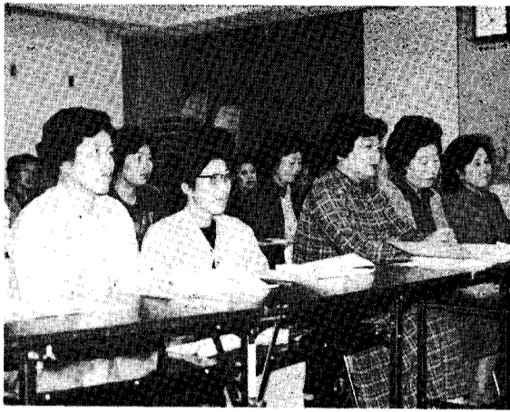
分館婦人学級開級式風景

小須戸町中央公民館では、子供の教育について話し合い、子供と共に伸びる親となる為に、また非行防止の為に子供のしつけと親の役割を考慮するなどをねらいとして、昭和五十九年度家庭教育学級を開級いたしました。