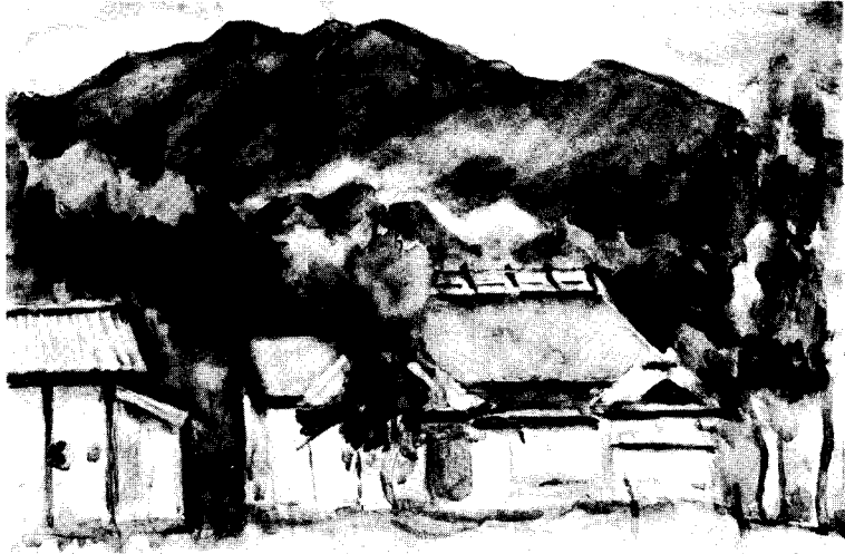
水彩クラブ「初夏の奥三面」 田沢義明