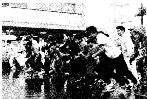
雨天の中、一斉にスタート