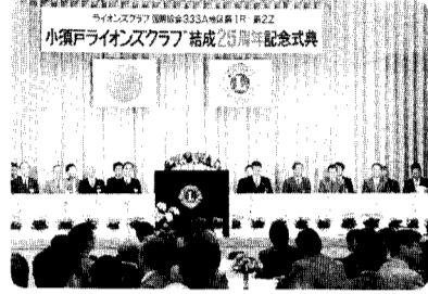
200人が参加して行われた記念式典。

ライオンズクラブ国際協会は一九一七年六月、創立者メルビン・ジョンズが、アメリカ合衆国シカゴ市で結成。日本には戦後の賠償と戦犯の処刑を対目感情をいだいていた苦しい時代に恩賜を越えて人類の進歩と平和を願うライオンズ精神のもとに、フライピン・マニクラブの援