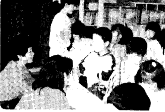
11日 親子文庫 みんな本をいっぺこと借りてお父さん、お母さんから読んでもらえねえ。