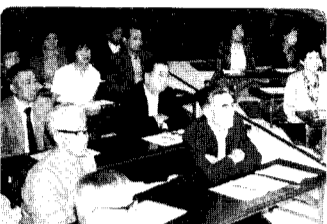
11日 おもしろ雑学講座 ビデオで「てんびんの詩」をみているみなさん 商人の道のけむしさを知った講座でした。