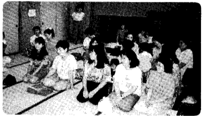
花積先生のお話にも耳をすますサークルのお母さんたち。

○特に心を育てることで、お母さん方から欲しいことは、三つ大事なことがあります。一、できるだけ触れあうこと。だっこやおんぶ、添い寝をすることで心が安定する。