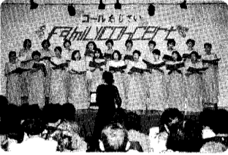
17日 「コールあじさいファミリーコンサート」あじさいの美しい歌声に観客のみならずもウツリ、100点満点でした。