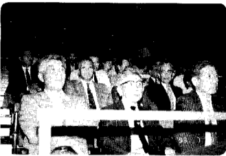
15日 新潟県公民館大会シンポジウム「公民館の課題を考える」私たちもあらためて考えさせられた大会でした。