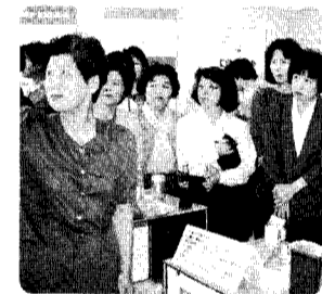
矢代田分館婦人学級、真剣なまなざしです。

ムの間で激戦となり、応援員も(特に、松チームは囂託員の皆さんが多数参加、熱のこもった声援が飛びかかっていました。