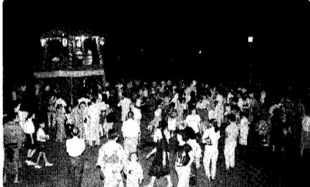
(現在) 大川前 児童公園