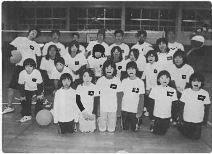
ともに楽しむスポーツの輪

「兎年の人？」「ハイ」 「えっ、六人もいるの？！しかも四世代？」（上は四十？下は五・六歳）と、老若男女約三十名で、水・土曜の夜、矢代田小学校体育館にて、ソフトバレーボールをしています。六人制バレーと、ルールはほぼ同じですが、やわらかいゴムボールでバトミントンコートを使い四人制です。試合も、小学生・ファミリー・混合チームなど多様で、小学生チームは新津の大会三連覇中で、大人の混合チーム