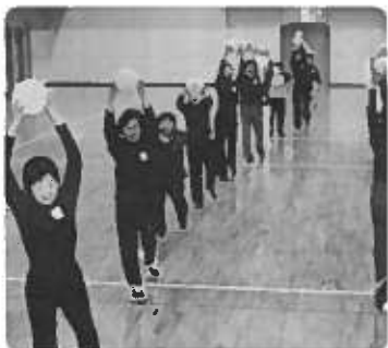
あなたもどうぞ！楽しくストレッチ

田代(矢)子 昨年の十一月、公民館からのお誘いで3B体操に参加させて頂き、全三回の講習でしたがとても楽しいひとときでした。参加者の中で是非続けたいとの希望者七名で、今年一月に発足した「サークルひまわり」です。 3B体操とは「健康で安らかな心、健康で美しく、健康で美しく老いる」をスローガンとする健康体操です。三つの用具(ボール・ベル・ベルト)を使い音楽に合わせて普段あまり使わない筋肉をストレッチ、踊り有り、ゲーム有り、脳活性化運動有り、誰にでも出来る簡単な体操を楽しみながら