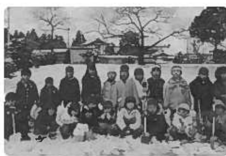
あそんだあとに「はいチーズ」

子ども達は、雪あそびが大好きです。雪を見るとじっとしていられます。寒さなんてなんのその!「ねえ、外へいこう」と誘いに來ます。園庭となりの児童公園は、起伏にとんでおり、自然のスロープがいくつもあり、ソリスベリには最高です。ソリを待つていられない子は早々「しりすべり」です。あちこちに雪遊びのグループもできています。 雪だるま作りをする子たち「目、なににする?」「葉っぱにする?」。シャベルを持って雪掘りをする子たち。絵の具で色をつけた雪で型ぬきをする子たち「プリンはいかが」お店屋さんごっこも始ま