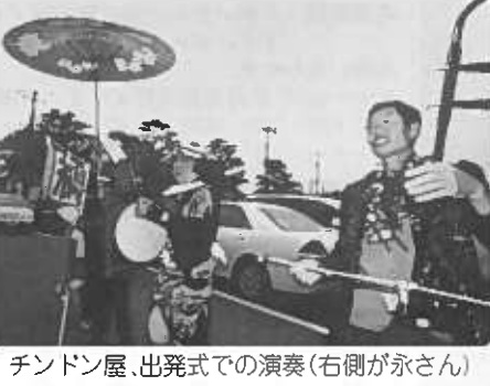
チンドン屋、出発式での演奏(右側が永さん)