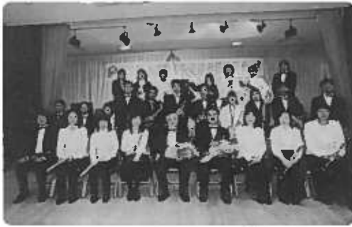
当日演奏メンバー整列

「めったに聴かんね、生の演奏を聴くことができて、ばかいかつたてえ〜」、「曲数も多くて、すごく感動しました。」等、満足感一杯の声を聴きました。