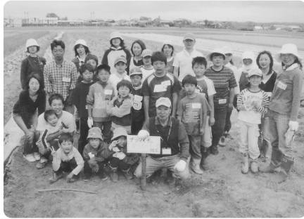
今から収穫が楽しみ。全員、充実の表情。

今年も五月八日に茂林寺で、花祭りが行われました。お祭りでは年に一度、五月の大祭に子育て延命地藏尊がご開帳され、子宝に恵まれたい人や長寿を願う人が近郷近在からは勿論のこと、県外からもお参りに訪れていました。 清々しい青空の下、五月下旬に公民館主催の親子チャレンジ教室が行われました。全員で慣れないくわ等を使い、やっとの思いで畑に長い一本のうねが完成しました。そのうねを子ども達の人数分で平等に区切り、親子でサツマイモの苗を植えました。