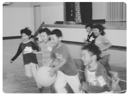
「ボール遊び楽しいよ！」

矢代田ひまわりクラブでは週に一回「ふれあい会館の日」を設けています。今年度は毎週火曜日。指導員が小学校まで子ども達を迎えに行き、皆でふれあい会館まで行きます。着くやいなや「お願ひします。」の声とともに、多目的ホールへとまっしぐら。ソフトボールを貸していたら、サッカー選手続出です。チームを作りゲームをしたり、何人かでボール遊びをしたり、ちよつと休憩タイムには折り紙をしたり…と、思い思いに遊んだ後、最後には、全員(希望者)での手つなぎオニタイムです。なかなかつかまらない時は、段々と範囲を狭