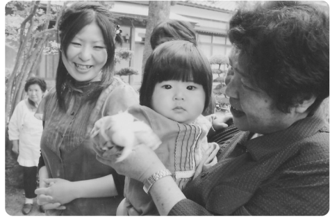
健やかな子どもの成長を願って