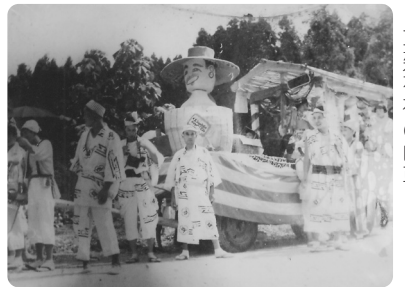
(昭和35年頃) 草薙神社の山車