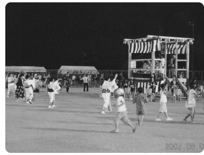
ナイターの光を浴びて盆踊り

開会式の後にはグラウンドで、小学生の樽囃子による小須戸甚句、結心こすどのよさこい演舞、最後に地域に伝わる雄壮な太鼓に合わせたの盆踊りがありました。カクテル光線に映える緑の芝生の上でくりひろげられる踊りは、生命のエネルギーと輝きに満ちていました。