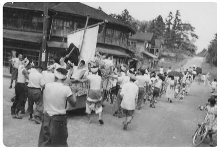
(昭和28年) 三沢八幡宮大祭での山車