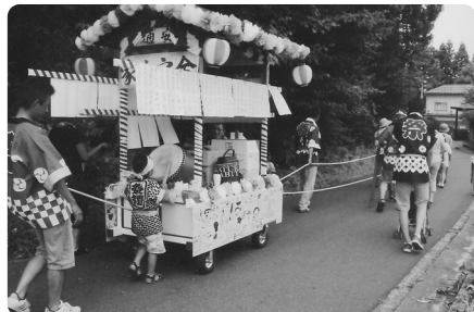
山車の太鼓で景気づけ (矢代田3・4常会)