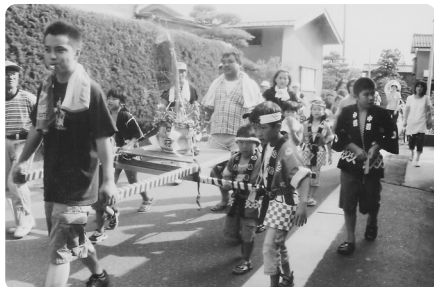
ふたてに分かれて回ってます (新保)