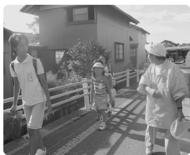
朝から会話ははずむ登校時

最初は「おはようございます。」と声をかけても、怪げんなような顔をして返事が返ってきませんでしたが、続けていくうちに子どもたちから、笑顔で声をかけられるようになりました。 これからはオレンジのジャンパーで子ども達を見守っていきたくです。 (参考)矢代田小学校の安全パトロールの色はグリーンです。