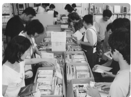
初日から賑わいをみせた図書室

《平成19年度・図書リサイクル 利用状況の結果について》 大勢のご利用、ありがとうございました。 八月十四日(火)から二十八日(火)まで図書室で図書リサイクルを実施しました。一人・七三七冊(対象書籍全体の約85%)の利用がありました。来年も実施する予定です。