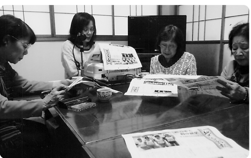
老人福祉センターでの録音

暑い夏の日には早朝五時から作業をしてくれた事もありました。おかげで、小学校の校舎まわりがとてもきれいなになりました。「雑草だらけだ の環境整備をしてきています。