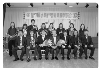
あなたも団員になりませんか