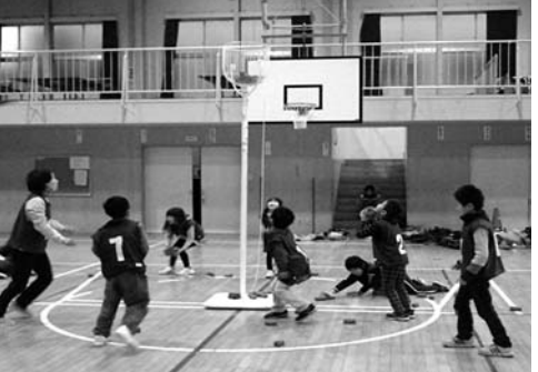
チームで一致団結!

「クラブの中は常夏!」 小須戸ひまわりクラブは、学校から少し距離があるので雨や雪の日は濡れてしまうこともありますが、寒くても元気いっぱいの子どもたちです。クラブに帰って来ると、まずはおやつタイム。おしゃべりもはずみ、それはそれは楽しそうに食べています。そして次は学習タイム。宿題と、二・三年生は自主学習もあります。ついつい横道にそれしてしまうこともありすが、わからない所は友達や指導員に聞いたりしながらできるのは、クラブならではの特典でしょうか? 頑張った学習のあとは、自由時間。ブロック、ウノ、す