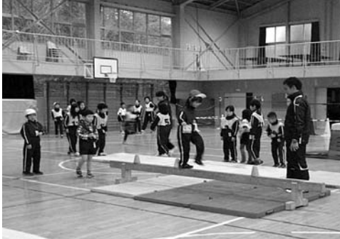
平均台、うまく渡れるかな?