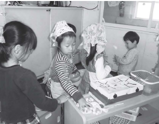
レストランの厨房は大忙しです

「お店屋さん」の楽しさ 年長のばら組さんが、空き箱や紙、廃材を利用して、アイスやお寿司、アクセサリー等色々な品物作りをしてお店屋さんを開店しました。小さな組のお友達が紙で作ったお金を持って買い物に行きます。 「これにしようかなあ」と迷いながらアイス屋さんやお寿司屋さんで買い物したり、レストランでメニューをみながら「これください」と注文してごちそうを運んでもらったり、美容室のコーナーで髪をセットしてもらったりして楽しんでいきます。お店屋さん毎日