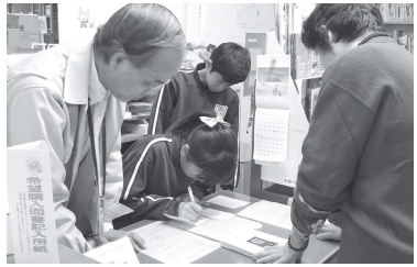
図書の貸し出し作業にちよっぴり緊張・・・

最後は図書室で本の貸し出しの作業を体験しましたが、緊張しながらも真剣に取り組みました。実際にやってみて良かったことが良い思い出となり将来社会人として役立つのでは無いでしょうか。