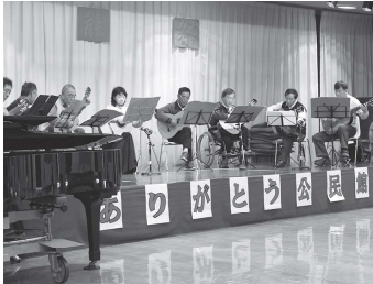
クラシックギタークラブ