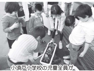
小須戸小学校の児童全員が協力しながら花を植栽

小須戸小学校全校児童で十月十五日に花の苗を植えました。緑化ボランティアが校内の緑地整備などを地道に行つていますが、児童たちもパンジー等色とりどりの苗をプランターに植え付けました。縦割り班に分かれてそれぞれ協力しながら植栽体験をしました。「まちづくりセンター」へ設置される予定です。十一月十八日には矢代田保育園児が山の手コミュニティ協議会環境部のメンバーから花の植え方を習い、寒さに負けずみんなで協力して花を植えました。「きれいに植えられてよかった。」と楽しそうでした。