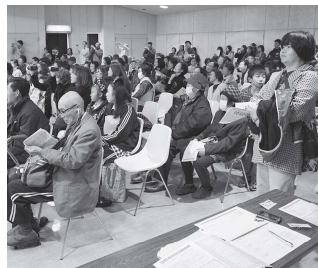
熱演に見入る観客