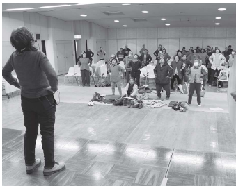
操体法でリフレッシュ