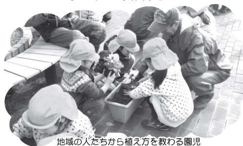
地域の人たちから植え方を教わる園児

同日、公民館と山の手コミュニティ協議会が連携して「冬でも花いっぱい運動」を行い、この事業は、同じ作業をすることで地域の絆の強化を図ることを目的に行われていますが、植栽したプランターは矢代田駅や小須戸交番、ひまわりクラブにも設置されます。「話をしながら作業をするのは楽しいから、地域の中が花いっぱいになるのはとてもいいですね。」と参加者は話していました。