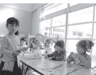
「このめがねください」