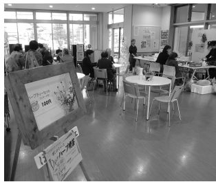
ハーブ茶で一休み

10月29日(土)30日(日)の二日間にわたって開催された第42回「市民展」は今年も多くの方が会場の小須戸まちづくりセンターに来場され、盛況のうちに無事終了となりました。