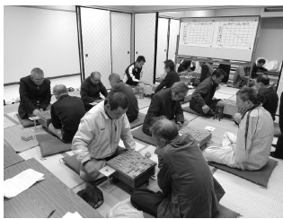
時間が経つのも忘れて