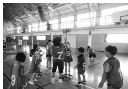
8/7 アジャタ・スリッパ卓球 (小須戸体育館)

ひまわりクラブの子どもたちは、「アジャタ・スリッパ卓球」「ゲーム・ダンス」を体験しました。