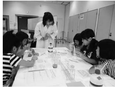
8/22 科学実験 (まちづくりセンター)

大人気の「やってみよう科学実験」は、今年も新潟薬科大学災害ボランティア部の皆さんから講師をしていただきました。「指紋の検出」「ビタミンCが多い飲み物は？」「スライム作り」どれも興味津々の内容に子どもたちは驚きと想像力を掻き立てていました。