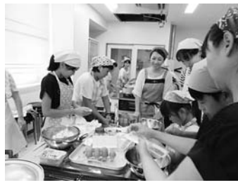
7/30 おはよう朝ごはん (まちづくりセンター)

今年の夏休みも子どもたちには様々な体験が待っていました。小須戸コミ協との共催で、食生活改善推進委員の皆さんから「おはよう朝ごはん」の講習を受けました。