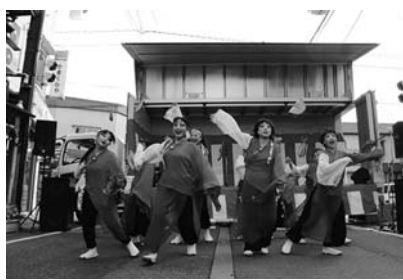
8/20 商工まつり 結心こすどのよさこい踊り