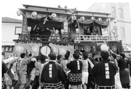
8/25 小須戸喧嘩燈籠まつり

3点目 江戸時代から続く伝統の小須戸喧嘩燈籠祭り。朝降っていた雨もあがり、街に威勢のいい掛け声とともに勇壮な燈籠が練り歩き、夕方には激しい押し合いが行われました。