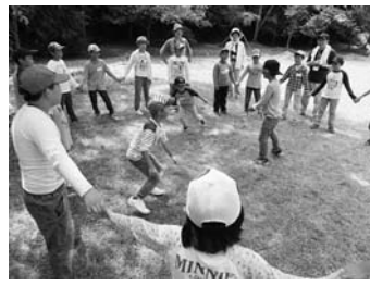
8/4 デイキャンプ (大沢森林公園)

地元天ヶ沢の「大沢森林公園」でデイキャンプを行いました。自然とふれあうネイチャーゲームやアルファ米作りを体験しました。