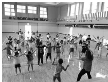
8/17 チャレンジダンス (ふれあい会館)

新しい発見と思いついた残りの夏休みで、来年も多くの皆さんの参加をお待ちしています。