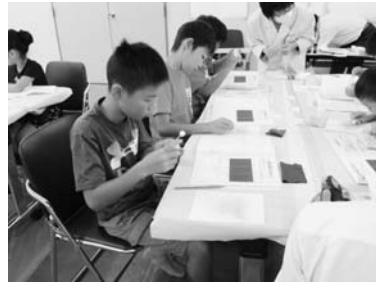
8/23 科学実験 (ふれあい会館)

地元天ヶ沢の「大沢森林公園」でデイキャンプを行いました。自然とふれあうネイチャーゲームやアルファ米作りを体験しました。