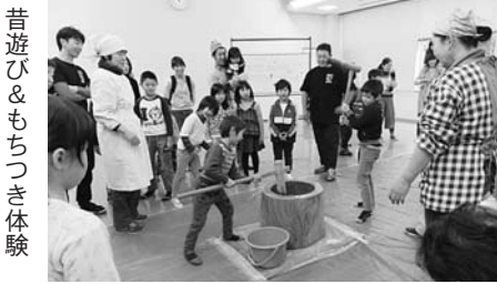
昔遊び&もちつき体験 12/2

ふれあい会館で山の手コミ協との共催で12月2日(土)、「昔遊び&もちつき体験」を25名の小学生が参加して行われました。ボランティア団体の「アソボーレニイガタ」の皆さんからけん玉や独楽を教してもらい、もちつき大会で大いに盛り上がりました。