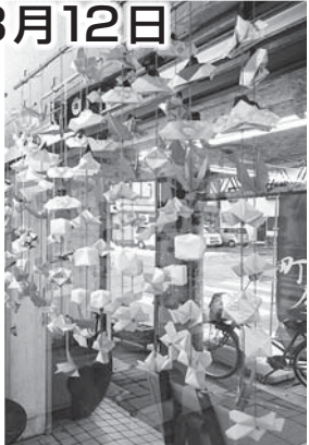
昨年の折り紙で作った吊るし飾り