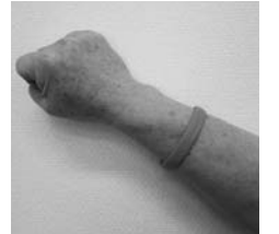
ブレスレット(オレンジリング)