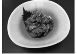
・アジのなめろう ・冷しゃぶの梅ドレ和え ・夏野菜の貝沢山汁