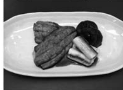
・アジの蒲焼き ・きゅうりとみょうがの和え物 ・アジのすりなごし汁