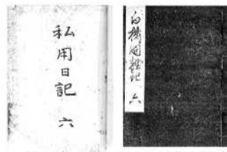
本多家文書「私用日記」と「白濁川雑記」

●おすすめ Point! 今年のテーマは「歴史と信仰」 地域学講座も5年目となりました。5年目の今年は、小須戸の歴史を「西郷どん」の活躍した時代に併せて迎えます。