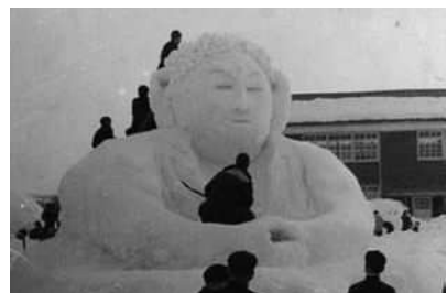
昭和38年小須戸中学校 雪の芸術展