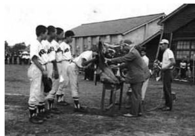
昭和38年小須戸中学野球部 三市中蒲大会で優勝

アルバムを見せても良いよという方は、まちづくりセンターにお声がけ下さい。(電話 25-7069)