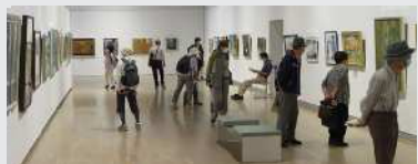
昨年の秋葉区美術展の様子