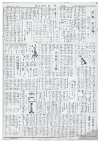
(上)歴代公民館報 題字の変遷