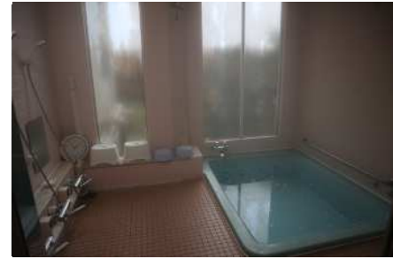
浴室(上)と大広間(下)