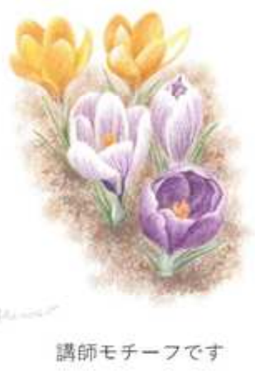
講師モチーフです