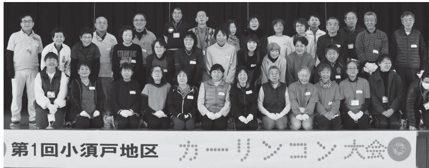
第1回小須戸地区カーリンコン大会