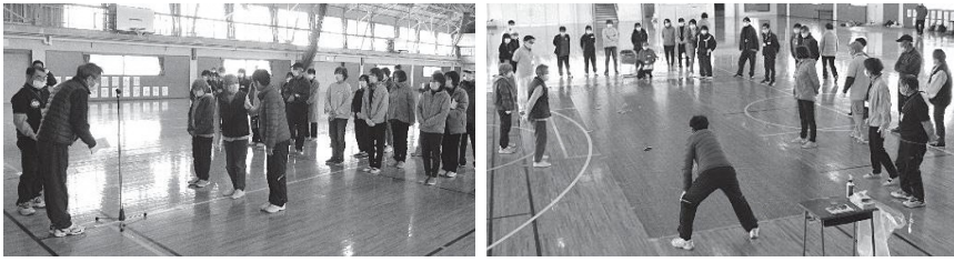
表彰式で賞状をもらうスクールAのみなさん

3月5日(日)、小須戸コミ協と共催で、小須戸体育館において、12チーム36名で初めて大会を行いました。大会結果は左表のとおりです。