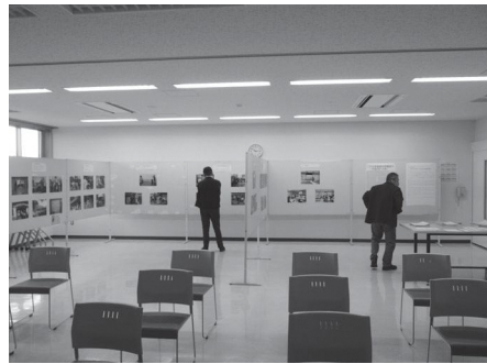
2階研修室の「こすど史楽会」の展示