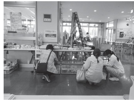
1階ロビーのまちセン不用品バザーと竹灯籠

10月28日(土)・29日(日)の2日間、第47回小須戸地区市民展が開催され、小須戸まちづくりセンターは賑わいに包まれました。 714名もの来場者が地域で活動している方々の作品の美しさに魅了されていました。