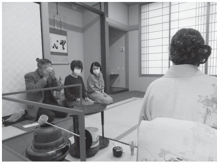
2階和室の「お茶席」の様子