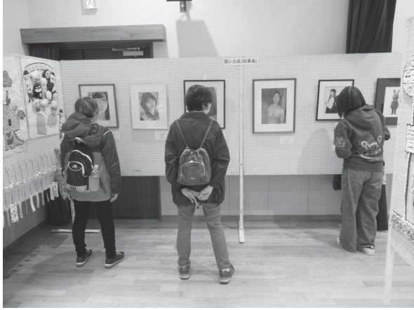
3階ホールの展示の様子