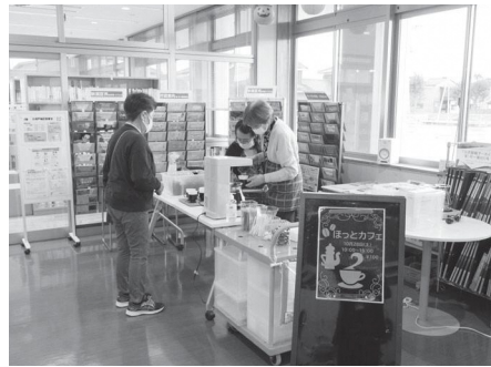
1階ロビーの「ほっとカフェ」の様子