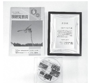
表彰盾(右)と月刊視聴覚教育9月号(左)と作品DVD(下)