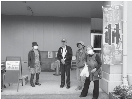
玄関脇での「寺社柿」の販売