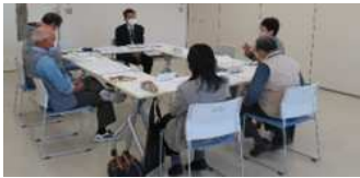
活動協力員会議の様子

公民館の力強い助っ人 「公民館活動協力員」を募集します。 あなたもやってみませんか？