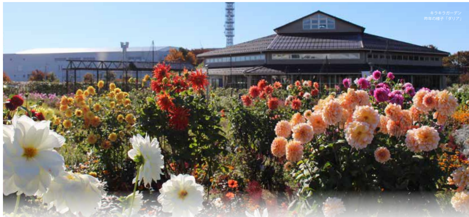
キラキラガーデン 昨年の様子「ダリア」