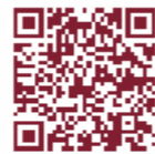
▲「渡るよサイン」の紹介動画はコチラ