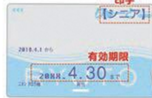
シニア半わり りゅーと

※1 記名式りゅーとを新しく発行する方は、りゅーとの購入申込書への記入とカード代金2,000円(預り金500円含む)が必要です。 無記名りゅーとをお持ちの方はご持参ください。記名式りゅーとに書き換える手続きも可能です。(無料)