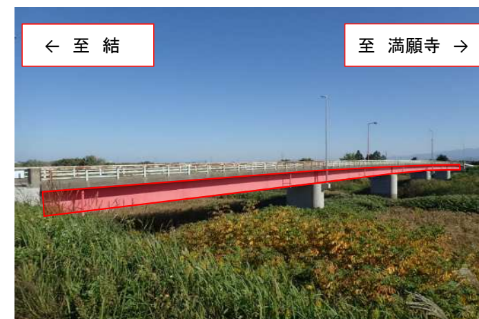
橋桁の全面塗装塗替