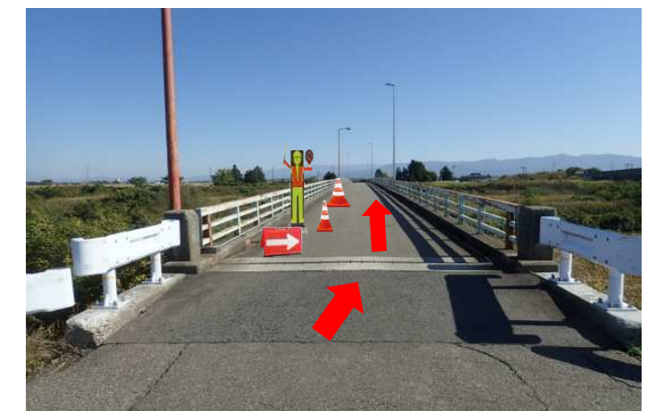
傷んだ高欄の取替え、舗装の打換え