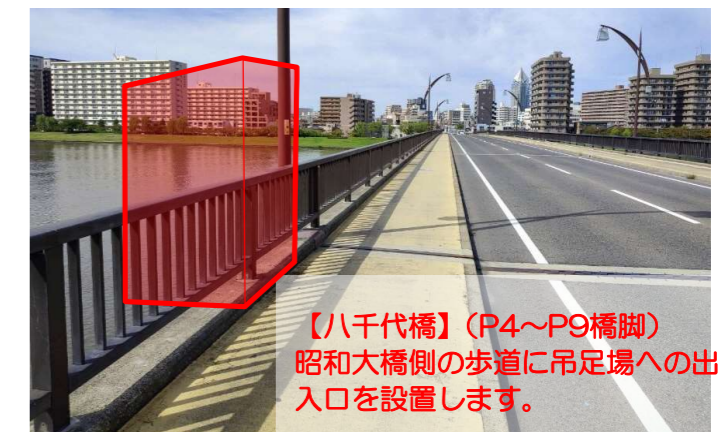
現場写真（施工時イメージ）