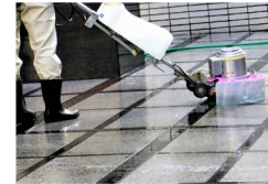
ビルメンテナンス事業