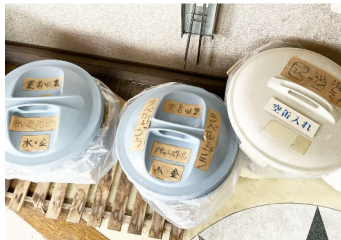
ペットボトル、缶/ビンの分別・リサイクル