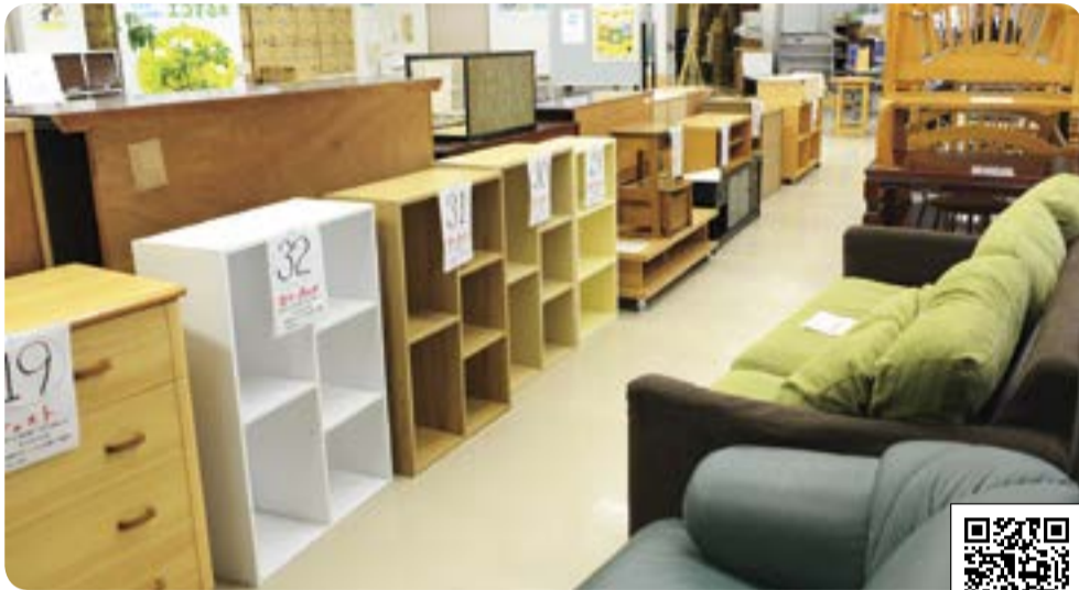
▲リサイクル品の展示の様子。展示内容はホームページでもご覧いただけます。

エコプラザでは、ご家庭で不用になった家具を無料回収し、必要としている方へ提供する事業を行っています。粗大ごみとして捨ててしまう前に、まずは電話でご相談ください。