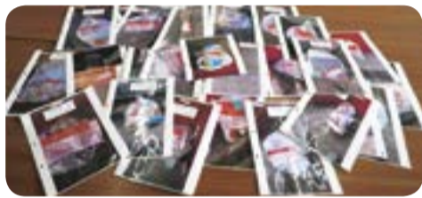
▲注意喚起のために作成した掲示物

違反ごみがあったら写真を撮って、ごみ集積場への掲示や回覧板で注意喚起しています。