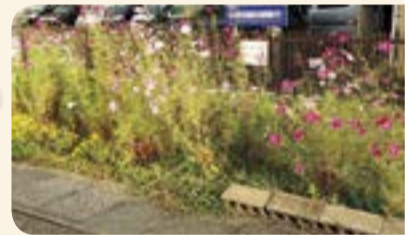
▲道路脇に植えたコスモス

道路脇を除草し、コスモスを植えたことで、景観が良くなり、ぼい捨てが減ったそうです。