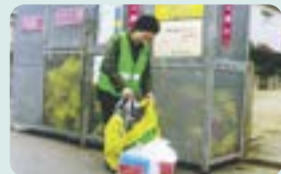
違反ごみ処理作業の様子