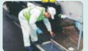
雨水ます清掃の様子