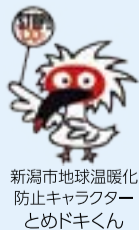
新潟市地球温暖化防止キャラクターとめドキくん

最新の機種は省エネ性能が進化しているから、古い機種を買い替えることで月々の電気代がお得になることがあるよ。