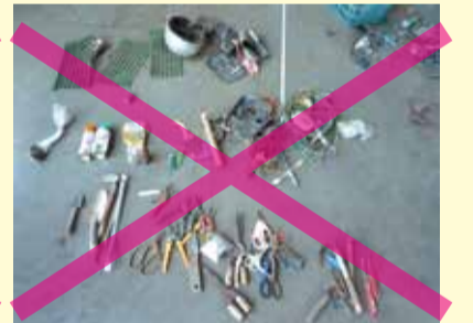
カマ、剪定バサミ、園芸用支柱、ピン、石、缶、ライター、スプレー缶、軍手など