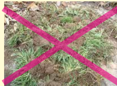
土砂が付いたまま、出されています!